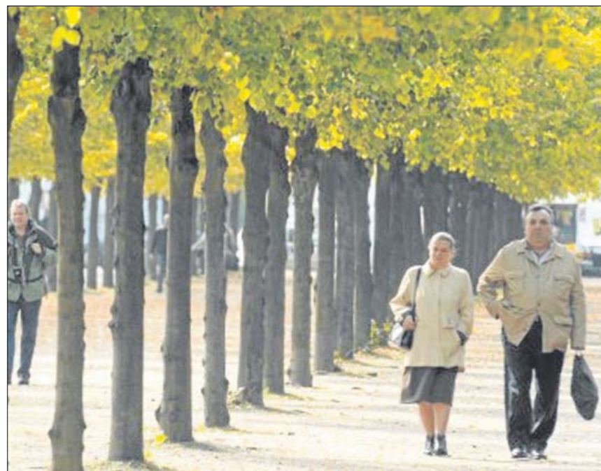
Rentenversicherung warnt vor steigender Altersarmut