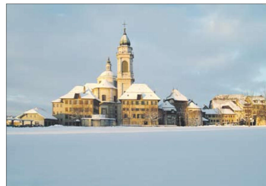
Ein Refugium für Menschen mit Sinn für Romantik ist das schweizerische Solothurn.

Nur 65 km von Basel entfernt und von Südbaden aus schnell und bequem zu erreichen liegt Solothurn, eingebettet am Rand des Mittellandes zwischen Aare und Jura. Die malerische Stadt ist bekannt als lohnenswerte Kulturstadt – doch auch im Winter weiß die vielseitige Barockstadt ihre Besucher zu verzaubern. Die kühlen Monate sind wie geschaffen für kleine Fluchten: Für ein paar Tage den Trubel hinter sich lassen, die besondere Stimmung auskosten und sich so richtig verwöhnen lassen. Ein Refugium für Menschen mit Sinn für Romantik ist das schweizerische Solothurn. Die idyllische Barockstadt am Fuße des Jura bietet alles zum Träumen, Entspannen und Genießen. Von oben aufs herbstliche Nebelmeer blicken und spüren, wie die Zeit still zu stehen scheint. Ausgedehnte Bäder genießen. Lange schlafen, fürstlich frühstücken und danach auf Casanovas Spuren flanieren. Durch die Verenaschlucht zur alten Einsiedelei wandern. Oder nach einem gemächlichen Spaziergang auf stillen Wegen entlang der Aare beim traditionellen Käsefondue in den Sternenhimmel blicken. Es ist nicht das Spektakuläre, das Kenner nach Solothurn zieht. Für sie zählen Muße und tiefes Erleben. Ohne Eile und ohne Termine – aber mit